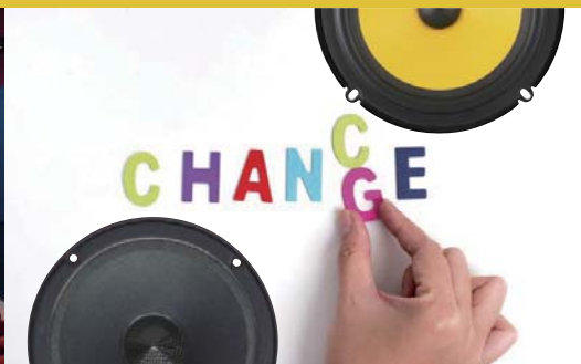
スピーカー交換だけでこんなに変わる