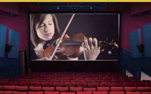
映画館のような臨場感