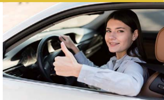
毎日の通勤が楽しくなる