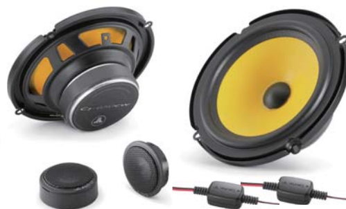
JL AUDIO C1-650