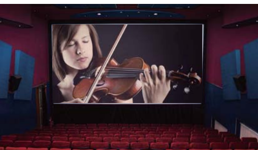
映画館のような臨場感