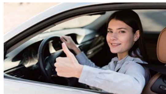
毎日の通勤が楽しくなる