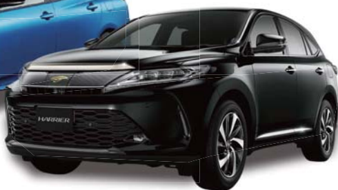
TOYOTA HARRIER (60系)