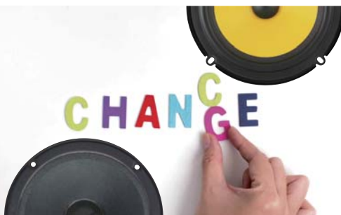
スピーカー交換だけでこんなに変わる