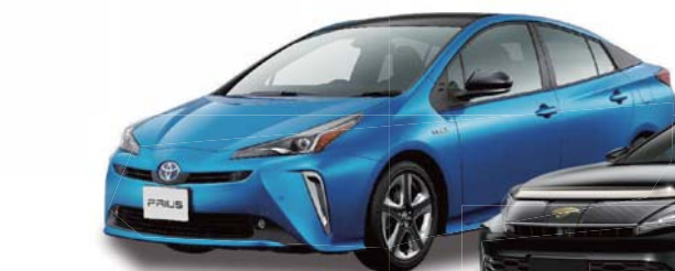
TOYOTA PRIUS (50系)