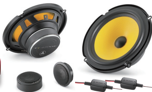
JL AUDIO C1-650