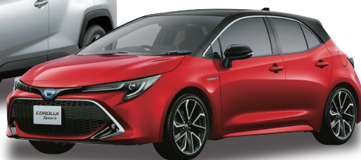
COROLLA SPORT (210系)