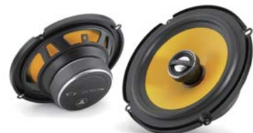
REAR : C1-650x