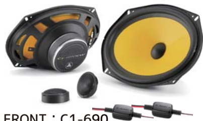
FRONT : C1-690