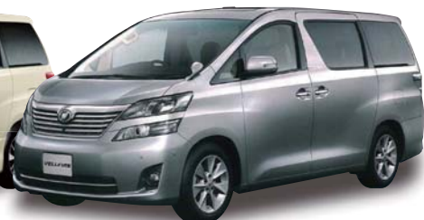
ヴェルファイア (20系)